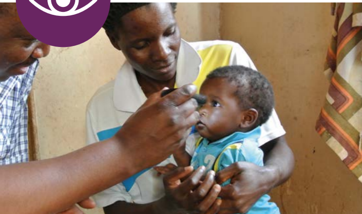
Augengesundheit: Für eine bessere Zukunft.

Spenden-Stichwort: Campaign 100 – Lichtblicke