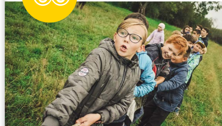
Lebenskompetenzen: Kinder und Jugendliche stark machen.