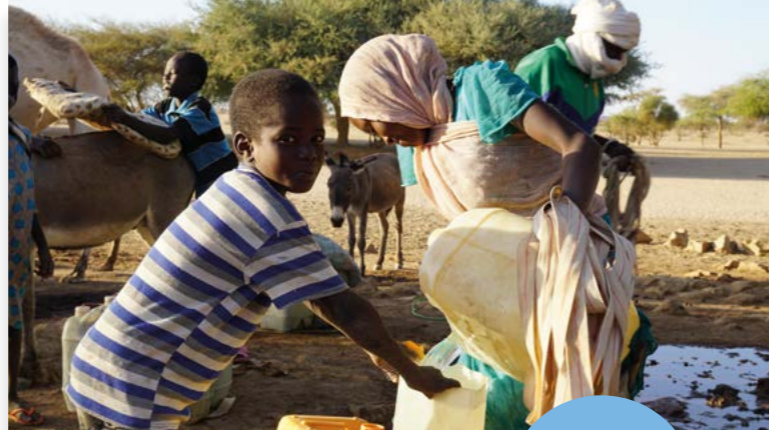
Lebenswichtig: Zugang zu sauberem Wasser.