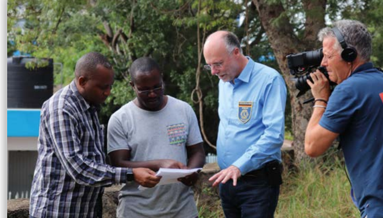
Dreharbeiten in Tansania: Jedes Jahr wird ein Film mit Lions vor Ort gedreht.